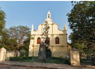
Cochin (Kochi) 📍