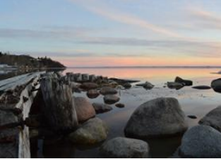
Cochin (Kochi) 📍