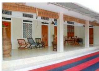
Mankombu 📍 🚲 35km Erattupetta 📍