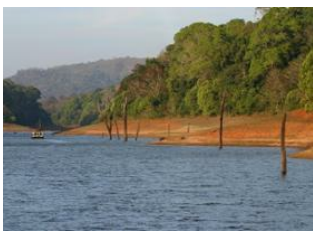
Erattupetta 📍 🚲 32km Periyar(Thekkady) 📍