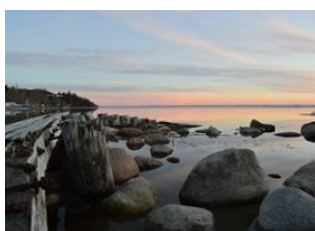
Cochin (Kochi) 📍