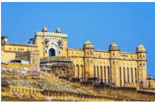
Pushkar 📍 🚲 95km Jaipur 📍