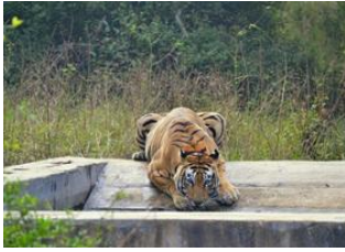
Sariska National Park