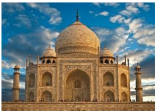
Bharatpur 🚲 35km Fatehpur Sikri 🚗 40km - ⌚ 1h Agra