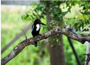
Sariska National Park 🚲 60km Bharatpur