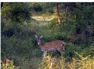
Jaipur 📍 🚲 75km Sariska National Park 📍