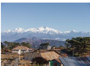
Sandakphu 📍 17km - ⌚ 6h Sabargam 📍