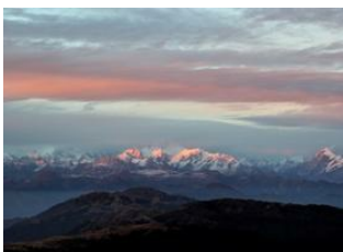
Kalipokhri 📍 6km - ⌚ 3h 20m Sandakphu 📍