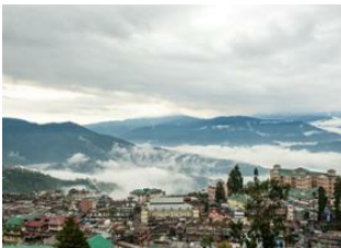
Samaden 📍 16km - ⌚ 6h Rimbick 📍