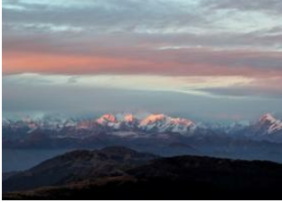
Sabargam 📍 14km - ⌚ 7h Samaden 📍