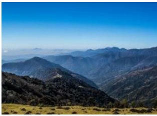
Tonglu 📍 15km - ⌚ 6h Kalipokhri 📍