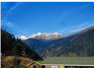
Yuksom 📍 3km - ⌚ 6h Tsohka 📍