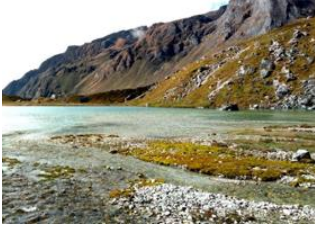
Thangsing 📍 4km - ⌚ 4h Samiti Lake 📍