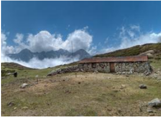
Tsokha 📍 4km - ⌚ 5h 30m Dzongri 📍