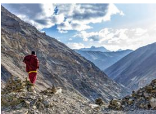
Dzongri 📍 4km - ⌚ 5h Thangsing 📍