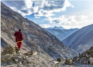
Samiti Lake 📍 - ⌚ 9h Thangshing 📍