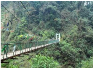
Gangtok 📍 🚗 120km - ⌚ 5h Yuksom 📍