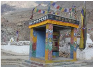
Nubra Valley 📍