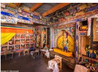
Nubra Valley 📍