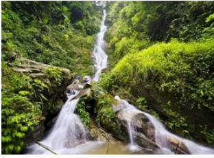
Yuksum 📍 🚲 35km Pelling 📍