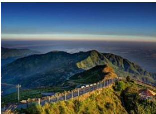
Darjeeling 📍 🚲 36km Kurseong 📍