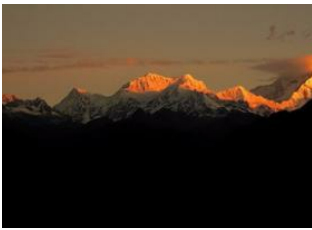
Pelling 📍 🚲 42km Rinchenpong 📍