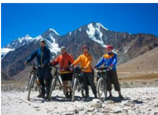
Ravangla 📍 🚲 50km Yuksom 📍 Yuksom 📍