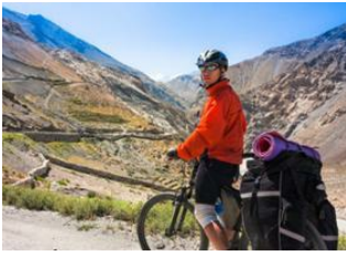
Martam Village 📍 🚲 35km Ravangla 📍